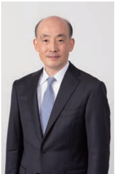
株式会社可乐丽 代表取締役社长