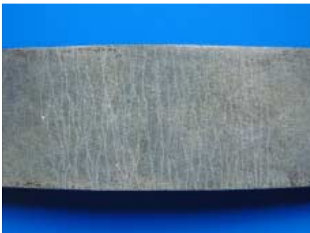
図-1 パワロン®ボードのマイクロクラック

当社は繊維補強複合材料である ECC ( Engineered Cementitious Composite ) 向けに、機械的物性や繊維表面特性を改良した新タイプの高強度ポリビニルアルコール繊維「クラロン K- 」をパワロン®と命名し、同繊維で補強された高靱性セメントボードパワロン®ボードの開発に成功し、販売を開始いたしました。パワロン®ボードは、抄造方式によって製造された薄くて靱性に富んだ板状セメント系材料で、このたび、株式会社大林組が開発したスムーズボード工法 ( 高靱性ボード埋設型枠工法 ) 並びに鉄建建設株式会社が開発したリディーム工法 ( 高靱性マット及び高靱性ボード補強工法 ) に採用されました。