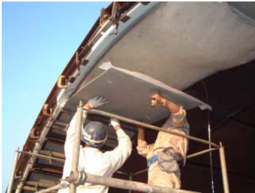
図-5 リディーム工法：パウロン®ボード設置状況

既設のトンネル被覆表面にビニロン繊維マットを貼り付け、その上から永久型枠を兼ねたパウロン®ボードを固定し、ボード上に設けた注入口からマット内部にグラウトを注入して補強材とするものです。トンネルのみならず、橋梁や床板等の高靱性化及び耐久性向上を目的とした補修及び補強工法です。