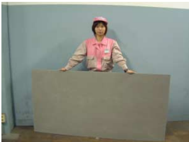
図-6 パワロン®ボード ( 910mm × 1820mm ) 全体図