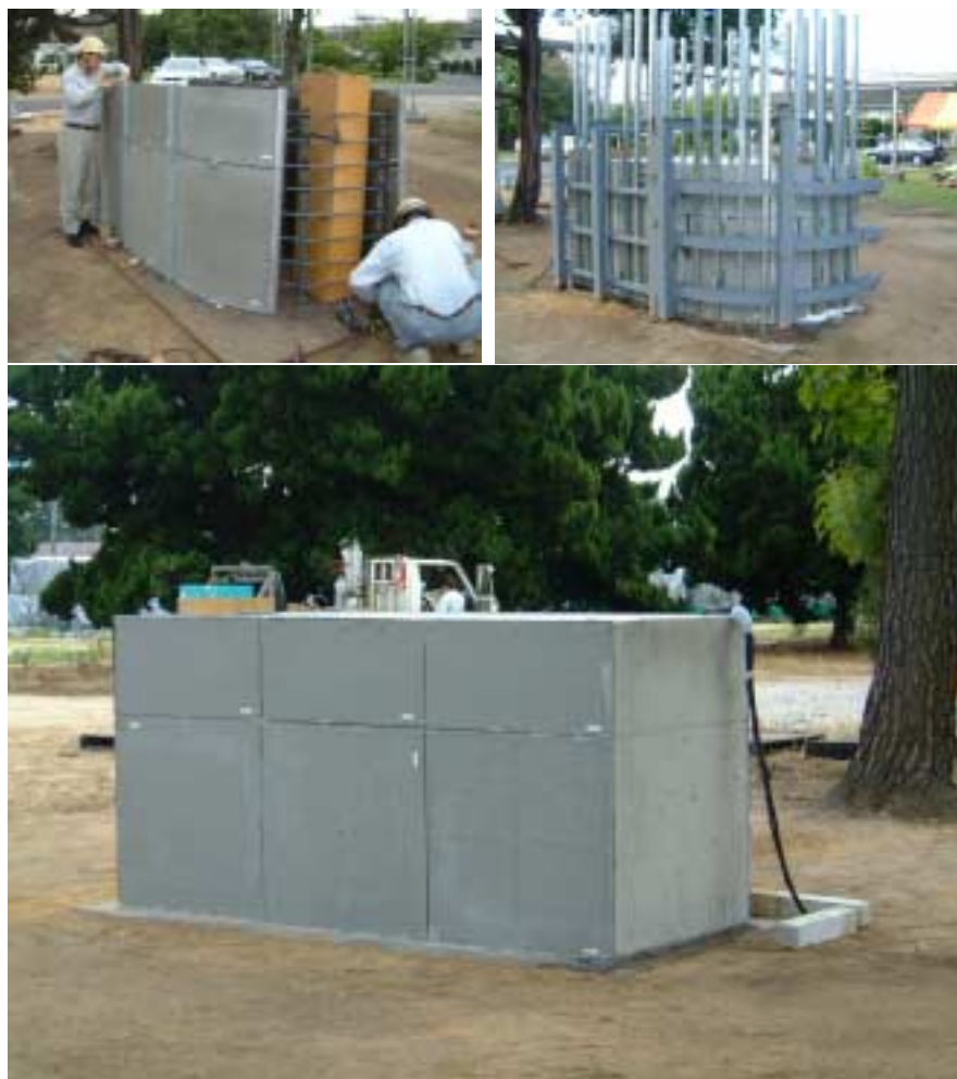
図-4 クラレ岡山事業所における埋設型枠実験状況 上段左：パワロン®ボード設置 上段右：支保工設置 下段：コンクリート打設 - 養生 - 支保工撤去後（完成図）

厚さ 8mm のパワロン®ボードのコンクリート接着面に予め適切な処置を施し、パワロン®ボードを埋設型枠として外側に配置し、内部にコンクリートを打設します。変形性能および耐衝撃性能に優れる上、緻密な構造のため、乾燥収縮、塩分浸透及び中性化が抑制でき、コンクリート構造物の耐久性向上が期待できます。