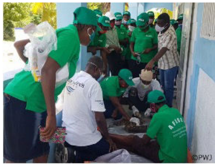
ピースウィンズジャパンによるハイチ地震からの復興を支援（カシュー加工研修）