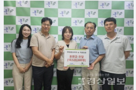
ムルプレへの寄付

クラレコリアは、工場がある蔚山（ウルサン）の福祉支援として2006年に設立されたシングルマザー施設であるMool-Pu-Rae（ムルプレ）へ寄付を行っています。賛同するクラレコリアの従業員からも寄付が集まり寄付金贈呈式を行いました。寄付への感謝として、クリスマスにはMool-Pu-Raeからイベントに招待されました。