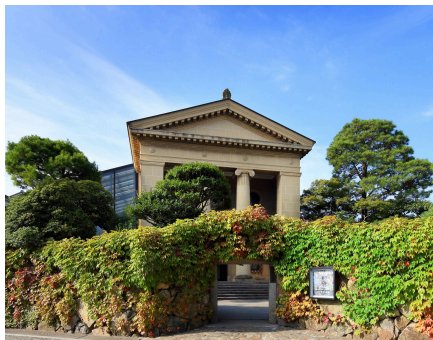
公益財団法人 大原美術館

クラレグループは日本の倉敷市という文化の薫り高い地から創業しました。創業者が明治の時代でありながら地元市民のために西洋絵画を収集し、それが世界的にも有名な大原美術館の設立につながりました。クラレグループはその生い立ちから文化を大切にし、大原美術館や愛媛民芸館をはじめクラレグループゆかりの文化施設サポート、クラレ財団での日本文化研究者の顕彰、絵画修復、若手美術家の育成等、多くの文化施設、文化活動を支援しています。