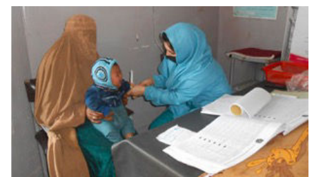
アフガニスタンで子供の栄養状況をチェックする カウンセラー

また使い終わったランドセルを募集し、その中に文房具や手紙を入れてアフガニスタンの子どもたちに贈る活動「ランドセルは海を越えて」を長年実施してきました。現地の子どもや母親たちの困難な状況を理解し、クラレ財団により公益財団法人ジョイセフを通じて母子医療に特化した支援も実施しています。