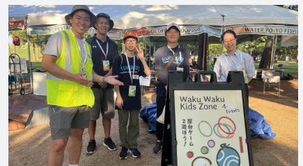
ジャパン フェスティバル