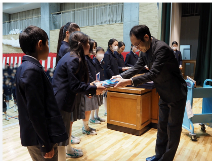
小学校への図書贈呈式