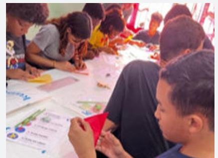
折り紙ワークショップ