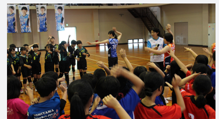
ふれあいバレーボール大会