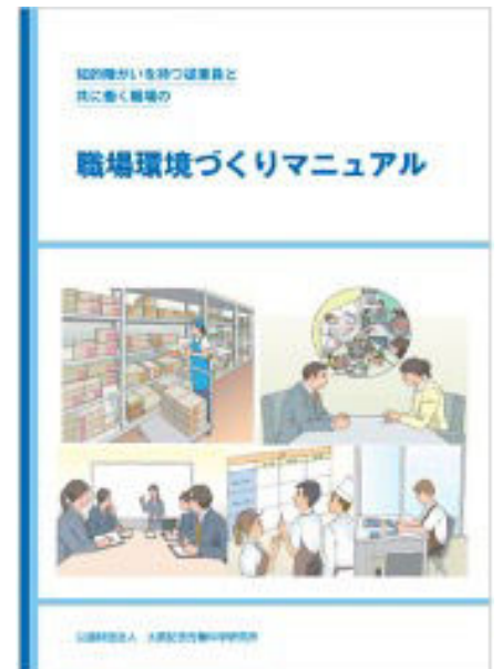
知的障がいを持つ従業員と共に働く職場の環境づくりマニュアル

国内5事業所では、1997年から知的障がい者の働けるクラレ作業所を設置し、障がい者雇用に関心に取り組んでいます。また、クラレ財団では、企業の障がい者雇用促進に資するため、公益財団法人大原記念労働科学研究所と協業し、知的障がい者の就労と雇用後の定着に向けた課題解決の方策を、労働科学の手法により研究してもらい、研究成果は一般に提供しています。