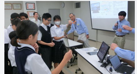
研究センター 見学会

つくば研究センターでは、弱者が参加するロービジョンフットサルのスポンサーとなっています。これをきっかけに当センターのフットサル同好会が交流戦の開催などを通じて、地域との交流の輪を広げています。また、2024年は、先進的な理数教育を推進している茨城県立並木中等教育学校の生徒を招待し、研究センターの見学や座談会を開催しました。今後も、地域社会との連携を深め、未来の科学技術の発展に貢献していきます。