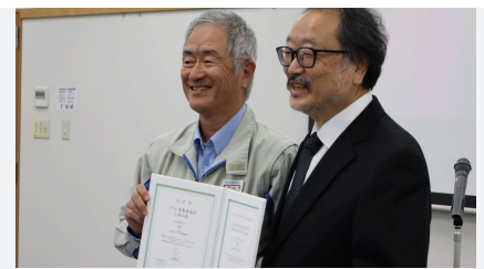
小鳥の森 認証式の様子

※ JHEP (Japan Habitat Evaluation and Certification Program : ジェイハップ) : 公益財団法人日本生態系協会が生物多様性の保全への貢献度を、客観的・定量的に評価、認証し、可視化できる国内唯一の認証制度です。事業実施によって得られる「将来50年間の自然の価値」が「評価基準値」を上回る場合、生物多様性の向上に貢献する事業、あるいは生物多様性へ影響を与えない事業として認証します。認証要件を満たすことが確認された事業は、ランク付けが行われます。(将来見込型を除き、AAA、AA+、AA、A+、A、B+の6段階評価)