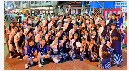
「中条大祭」前夜祭 民謡流し