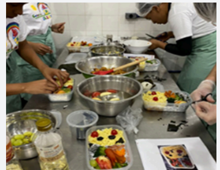
日本料理のワークショップ

「日本料理ワークショップ」では、日本食と日本文化におけるお弁当の歴史や意義を学ぶことができ、参加者は実際に調理をしてお弁当を盛り付ける体験しました。「折り紙ワークショップ」では、折り紙の起源やNASAの人工衛星に用いられた折り紙の技法などを学び、カエルや花などを作りました。