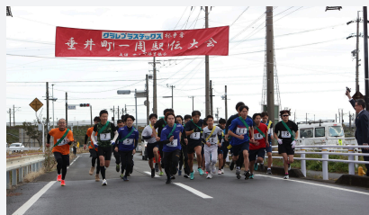
垂井町一周駅伝大会

クラレプラスチックは2016年から「垂井町一周駅伝大会」に単独協賛をしています。第58回を迎える2024年は例年に比べ風もなく暖かい日に恵まれ、当社からは2チームが出場し、一般の部17チーム中、7位・11位と大健闘しました。沿道では町民や応援に駆け付けた従業員の声援が響き渡りました。