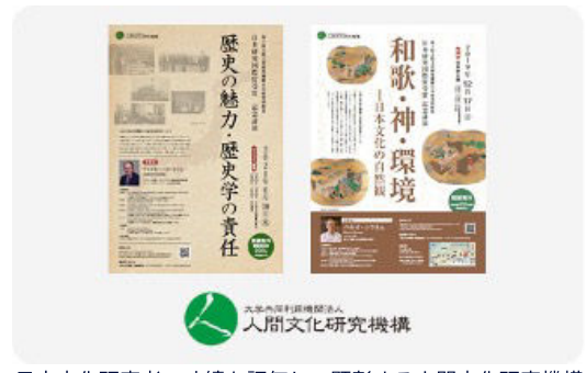
日本文化研究者の功績を評価し、顕彰する人間文化研究機構を支援