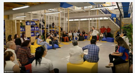
ライブ・ラボラトリー

クラレコロンビアはNGO財団であるユナイテッド・ウェイに協力し寄付金を拠出し、主に不安定な地域における教育プログラムの開発を支援しています。そのひとつに、カリブ海地域では初めての学習方法革新に特化した「Laboratorio Vivo (ライブ・ラボラトリー)」があり、新しい教育アイデアの創造と実験を奨励しています。