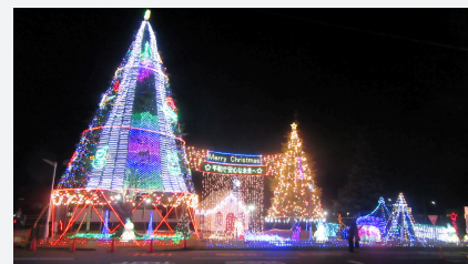
クリスマスファンタジー

さらに、倉敷事業所内に整備された『小鳥の森』が、公益財団法人日本生態系協会が実施する生物多様性の保全や回復に貢献する取り組みを評価するJHEP ※ 認証において、最高ランク（AAA）を取得しました。江戸時代に埋め立て造成された水島臨海工業地帯に位置しており、『小鳥の森』の整備時期（1964年～1966年と見られる）