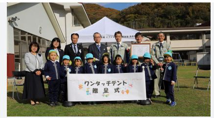
ワンタッチテント贈呈式

2025年も引き続き、SDGsの目標に考慮した生物多様性保全活動に取り組みます。活動内容として、生物多様性保全の必要性、海のゆりかごといわれているアマモの再生活動、事業所近隣の海洋ゴミの実態についての学習イベントを実施しています。加えて、子どもたちが自らの手で実験を行うことで化学に興味を持ってもらうため、また地域の方に事業所を知ってもらうため、2019年から毎年開催している地元観光協会と連携した公開型化学教室も同時に開催しています。