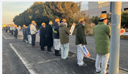
交通安全立哨活動

クラレノリタケデンタル三好事業所では、地域社会への貢献活動の一環として交通事故防止を目的とした交通安全立哨活動に参加をしています。三好事業所がある愛知県は交通事故死亡者数の全国一、二を争うエリアで、近くの幹線道路では昼夜問わず交通量も多いため交通安全の重要性が高まっています。このため、毎月1回、みよし市内に事業所を置く会社が順番に主要な交差点に立ち、通勤・通学中の歩行者や車両の安全を見守っています。三好事業所の従業員も参加し、交通安全意識の向上に努めています。今後も地域社会との連携を強化し、安全で安心な街づくりに貢献します。