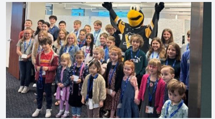
オフィス招待イベント

また乳がん啓発活動として、10月にカルゴンカーボンの従業員有志が、乳がん生存者と闘病者を支援するためピンク色の服を着用しました。また、ピッツバーグ地域のあらゆる年齢層の乳がん克服者に力を与えることを目的とした地元の支援団体「Pittsburgh Hearts of Steel」に寄付を行い、さらに意識と支援を広めるため、乳がんをテーマにしたクッキーを全拠点に郵送しました。