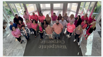
2024 United Way 乳がん啓発活動