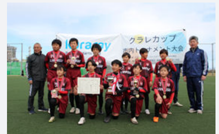
クラレカップ市内トーナメント大会

> 企業版ふるさと納税・感謝状贈呈式 コウノトリ巣塔お披露目 (YouTube動画)