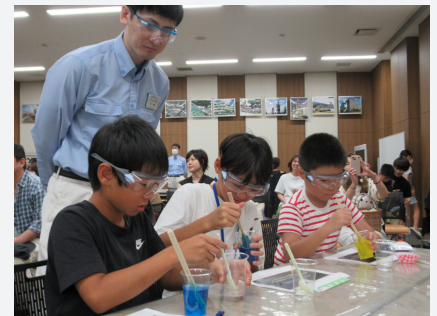
わくわく化学教室