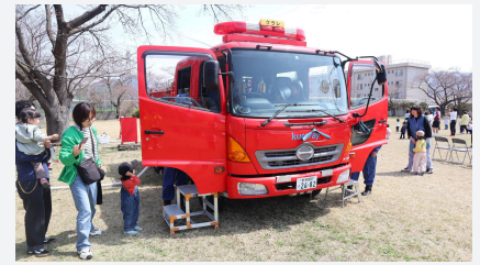
「桜まつり」消防体験

新潟事業所は自然環境、生活環境に貢献し、地域から信頼される事業所を目指しています。2024年は、例年春に開催している「観桜会」の規模を拡大し、地域住民の皆様との交流を深めるイベント「クラレ桜まつり」を開催しました。9月の地元の中条大祭の前夜祭「民謡流し」には、約70名の従業員が参加し、中条音頭を踊り、地域の方々と交流しました。また、コロナ禍で開催を見送っていた近隣町内会との情報交換会を再開し、最新の事業活動について紹介しました。一方、地域の生徒や児童の学術・スポーツ振興活動として、秋には第31回中学生ソフトテニス大会を開催し、白熱した大会となりました。学校だけでなく地域クラブからの参加募集を促し、15チーム約120名の中学生が参加しました。さらに10月には近隣の2小学校にて少年少女化学教室「ふしぎ実験室」を実施し、化学の面白さを伝えました。それらに加え「森づくり活動ミラバケツの森」や「たないきさい隊」ゴミ拾い活動などの環境保全活動、「ふれあい募金」を通じた地域福祉活動も継続しています。