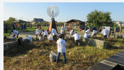
地元の公園や河川の清掃