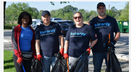
トラッシュバッシュ