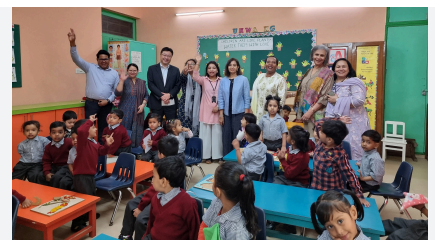
グリーンバザール

また、デリー・シーク・グルドゥワラという腎臓透析を必要とする患者へ無償提供する団体に対して継続的に寄付を行うとともに、2024年から新たにAkshaya Patra（＝ヒンデゥ神話に登場する「無尽蔵の器」）というNGO団体への寄付も開始しました。この団体は、貧困層の子どもたちが通う公立学校へ無償で給食を届けています。