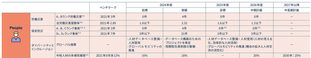
「PASSION 2026」期間中の重点施策目標と2024年度の実績