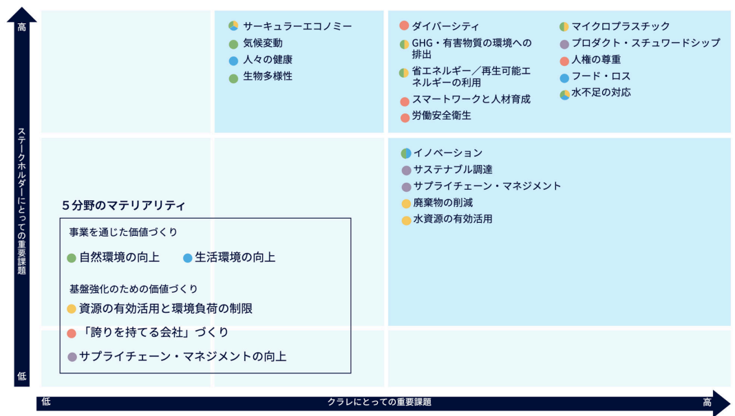
クラレグループのマテリアリティ・マトリックス

「コーポレートガバナンス」「CSRマネジメント」「倫理/行動規範」「リスクマネジメント」「ステークホルダーとのかかわり」「トップステートメント」はマテリアリティとは別枠で取り扱う事としました。