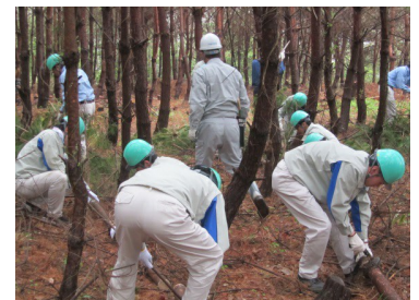
岡山：クラレ岡山みらいの森の作業風景

2017年度は、毎年活動している森林保全や清掃ボランティアを実施することを目標に、森林保全活動として岡山事業所の「クラレ岡山みらいの森」、新潟事業所の「ミラパケツの森づくり活動」を実施するなど全ての事業所で清掃ボランティアを継続して行いました。今後も、森林保全や清掃ボランティアに重点的に取り組みます。また、グループ会社においても事業所周辺の清掃活動などを定期的に行っております。