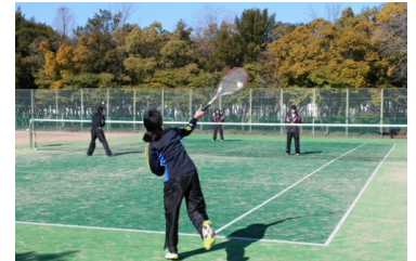
岡山：児童テニス大会

青少年育成の観点から、各事業所でスポーツ大会を開催しています。2017年度は、一昨年より取り組みを始めた岡山事業所での児童テニス大会を継続するなど、各事業所で各種スポーツ大会等を主催しています。また、会社の保有する野球場・体育館・テニスコートを近隣の学生向けに利用を開放し、地域スポーツの振興に努めています。今後も継続していきます。