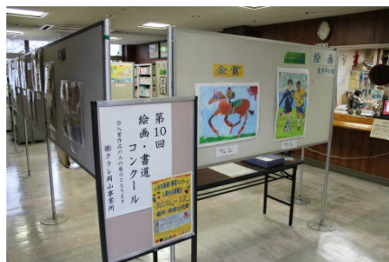
岡山：絵画・書道コンクール

岡山事業所では、2005年から「小学生絵画・書道コンクール」を毎年開催しています。本コンクールは、日頃の成果を発揮する場として定着しており、2017年度は事業所近隣の5つの小学校から約200点の作品応募がありました。今後も継続して取り組んでいきます。