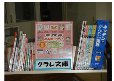
西条：ふれあい募金によるクラレ文庫

クラレでは、従業員の寄付金に、その同額を会社がプラスして行う寄付制度であるマッチングギフトを、「クラレふれあい募金」の名称で1992年7月からスタートしました。制度に賛同する従業員が月次給与100円未満の端数を積み立て、その同額を会社が拠出します。集まったお金は基金として、社会福祉に役立てるよう活用しています。2017年度は、各事業所の近隣にある福祉施設や自治体、学校を中心に、介護用品や図書等を寄贈するなど、地域に根ざした活動を行いました。今後も引き続き、基金を社会福祉に役立てていきます。